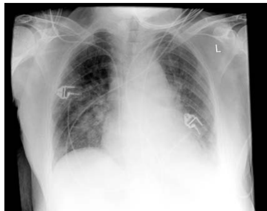
Abb. 2 Thorax-Röntgenaufnahme der Patientin mit Verdacht auf CMV-Pneumonie bei der Klinikaufnahme.

schweren, ambulant erworbenen Pneumonie. Sie wurde zur Überwachung auf die Intensivstation aufgenommen. Zur antibiotischen Therapie erhielt sie Ceftriaxon und Roxithromycin. Auf der Intensivstation blieb der Zustand der Patientin stabil. Kurzzeitig benötigte sie eine nicht-invasive Atemunterstützende Therapie. Der Zustand besserte sich aber nicht signifikant. Aufgrund eines positiven pp65-Tests und des Verdachts auf eine CMV-Pneumonie wurde die antivirale Therapie mit Valganciclovir ergänzt. Darunter besserte sich der Zustand der Patientin nun zügig, die Infiltrate lockerten im Verlauf auf und die Patientin konnte auf eine normale Station verlegt werden. Die Pneumonie heilte aus.