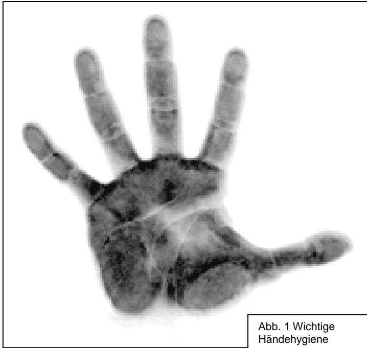
Abb. 1 Wichtige Händehygiene