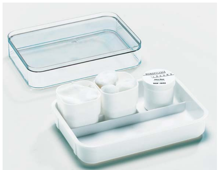
Abb. 2 Mundpflegeset.

Die Anfeuchtung der Mundschleimhaut kann unter Zuhilfenahme von flüssigkeitsgetränkten Tupfern und einer Pean-Klemme, Kornzange oder Magillzange er-