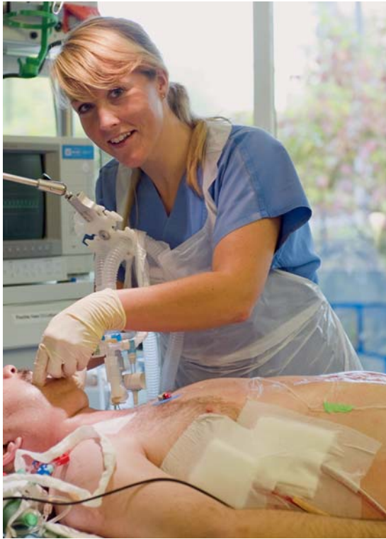
Abb. 3 Umlagerung des Endotrachealtubus und Kontrolle der korrekten Lage.

folgen. Pean-Klemme und Kornzange bieten den Vorteil eines sicheren Haltes des Mulltupfers durch eine Arretierung, die Magill-Zange erlaubt eine bessere Sicht in den Mundraum. Wichtig ist, dass die Mundspüllösung keimarm ist, jeweils frisch in keimarmen/desinfizierten, trockenen Behältnissen angesetzt wird und die verwendeten Instrumente nach Gebrauch desinfiziert werden (z. B. Abwischen mit 70% Alkohol). Das komplette Mundpflegeset wird mindestens einmal täglich